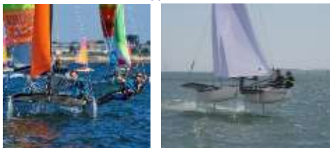
CATAMARAN // CATA À FOIL