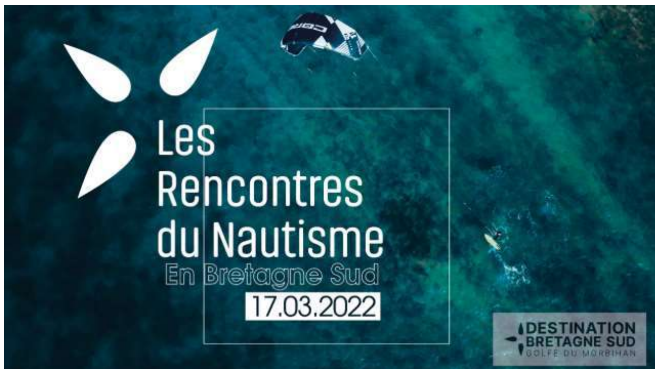
Table Ronde 2

La parole aux pros : quelles initiatives, innovations, partages et retours d'expériences des acteurs du territoire ?